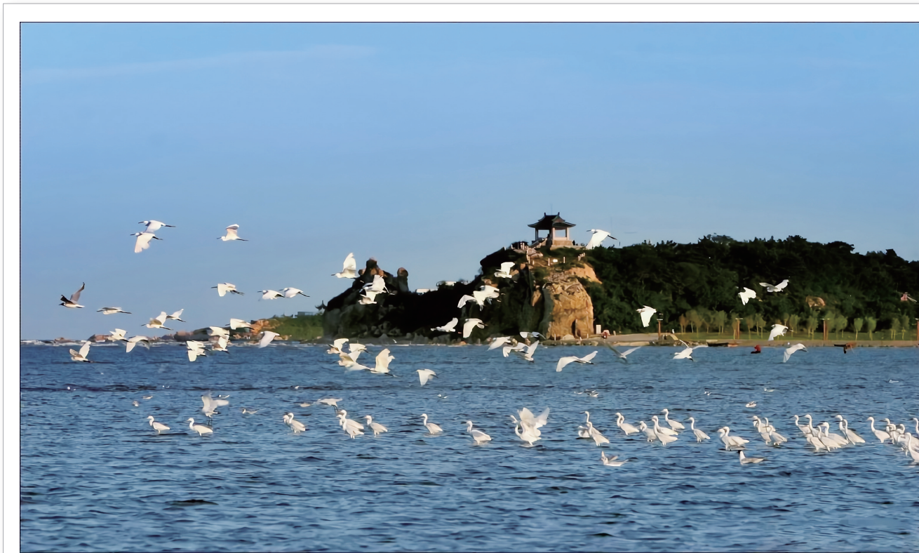
翱翔在云水之间